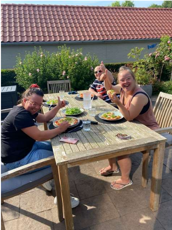
Lekker buiten eten, met zelfgemaakte pizza.

Wat hebben we een mooie zomer achter de rug! Bijna alleen maar mooi weer, zelfs tot eind oktober waren het lekkere temperaturen. Momenteel is het alweer vroeg donker en best fris, maar gelukkig hebben we de foto's nog..... ;)