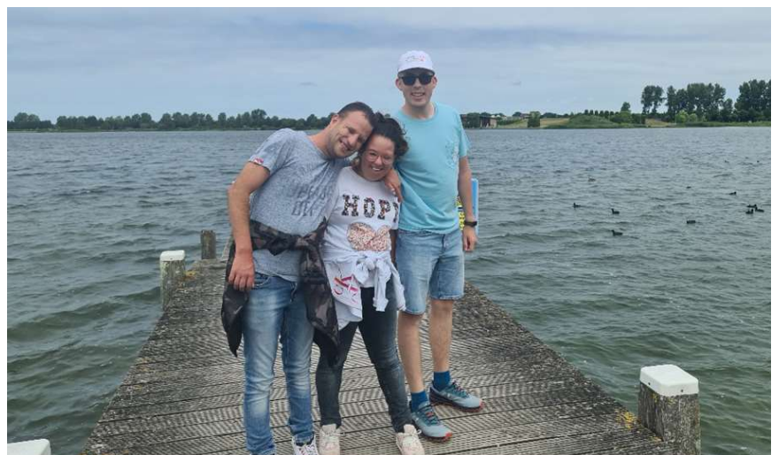
Rondje plas gelopen