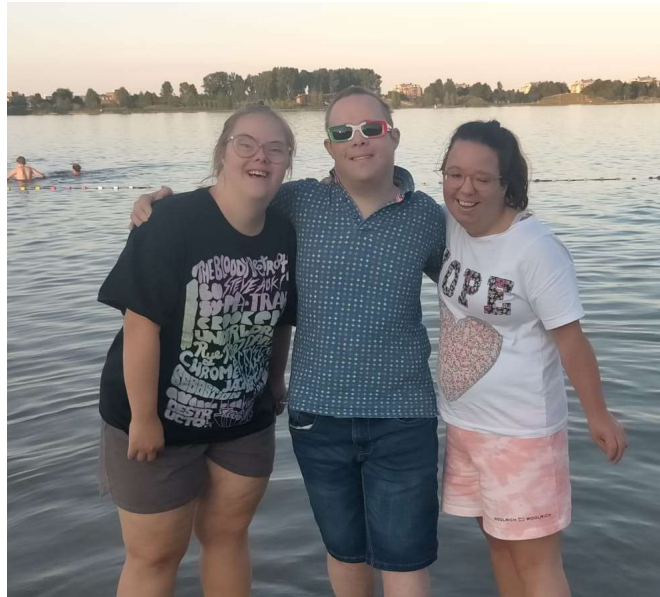
Zonnebaden bij de Toolenburgse plas